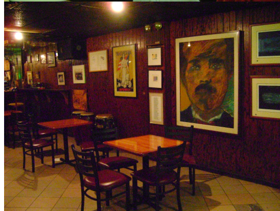
LA "RUTA OFICIAL" DE LA SALSA Zona Hotelera/Salsa Congress

A raiz del gran impacto en el turismo internacional que tiene el CONGRESO MUNDIAL DE LA SALSA, el cual se realiza anualmente en el lujoso hotel San Juan Casino de Isla Verde, la empresa